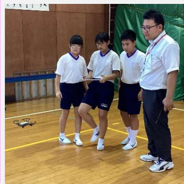
ドローン プログラミング教育

中でも、プログラミング教育は他市にはない特色があります。令和5年度から地元企業と連携し、「ドローンを活用したプログラミング教育」を市内全小中学校に展開（県内初）しています。プログラミング教育を通じて、「粘り強さ」や「自己調整能力」といった「非認知能力」の育成を目指し、日々研究と実践を重ねています。