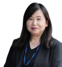
保健福祉局 保健福祉部 保健政策担当部長

岡山市では、「すべての市民が、病気や障害などの有無に関わらず生きがいを持ち活躍できる社会の実現」を目指し、取り組みをすすめています。保健師として、市民の声を丁寧に聞き、市民主体のまちづくりを様々な関係機関の皆様と協力して進めていくことは、とてもやりがいがあり楽しさもあります。ぜひ私たちと共に、健康で活力にあふれる岡山市を創り上げていきませんか。