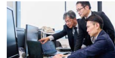
インターネット上で発生する犯罪の捜査や情報収集を行っています。