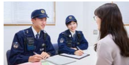
落とし物や困り事相談など、心情に寄り添った活動をしています。