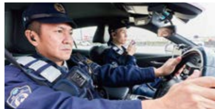
パトカーの機動力を活かしてパトロールを行い、犯罪の予防や検挙、交通違反の取締りなど、地域の安全確保に努めています。