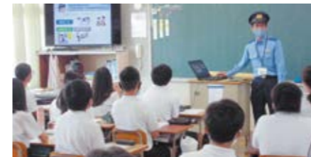
少年育成官や学校などと連携し、街頭補導、非行防止教室を通じて少年の健全育成を図ります。