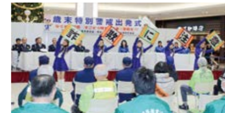
各種犯罪の抑止に向け、地域住民の方の防犯意識向上を目的とする広報イベントを企画・運営します。