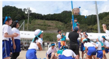
幼稚園・小学校・中学校合同運動会