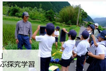
「あわくらみらい学」 地域の人モノから学ぶ探究学習