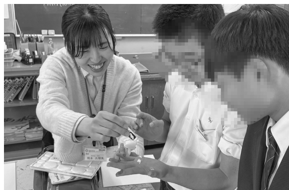
生徒と対話しながら制作を手伝っている様子

先生方はいつも声をかけてくださり、相談がしやすい環境です。分からないことがあれば、必ず先生方に確認しながら取り組むようにしています。自分で考えることも大切になっていますが、自分の判断だけで大きなミスをしてしまうことがないように、慎重に仕事を進めています。実は、中学生の頃にお世話になった美術部の先生と本校で一緒に勤務させていただいています。中学校以来の再会となり、とても嬉しく思っています。