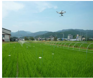
図1 ドローンを活用した水稲の生育診断

ドローンによる空撮で得られるNDVI※値から籾数や栄養状態を推定できる可能性が認められました(図1、2)。籾数が過剰な水稲が登熟期に高温に遭うと白未熟粒が増加するため、籾数や窒素吸収量の推定値から追肥の要否を判断する技術を開発しました。