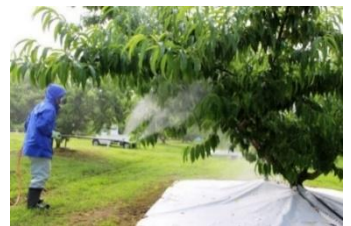
図4 エテホンの立木全面散布

成熟遅延による果肉障害の助長を回避するため、成熟促進効果のあるエテホン液剤の散布法を開発しました（図4）。