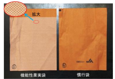
図1 開発した機能性果実袋(左)

果実温の異常昇温による赤肉症を抑制するため、慣行の果実袋に、赤外線反射機能の高い酸化チタンを塗布した機能性果実袋※を開発しました（図1）。※特許第5877441号