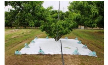
図2 部分マルチの敷設

成熟前の大雨により助長される水浸状果肉褐変症を抑制するため、主幹を中心に樹冠下4m四方に透湿性防水マルチを敷いて雨水を防ぐ部分マルチ法を開発しました（図2）。