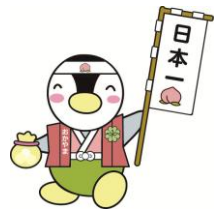
岡山県版ミンジー