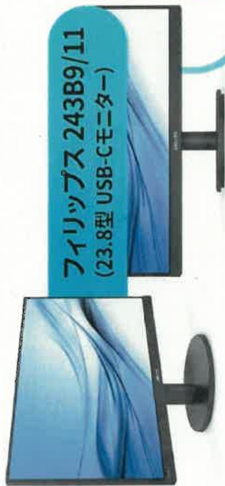
フィリップス 243B9/11 (23.8型 USB-Cモニター)

効率性と快適性を追求したビジネス向けハードウェア（モニターとノートPC）の主要な特長とメリットを伝え、生産性の高いオフィス環境の構築を提案する。