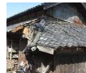
緊急代執行を要する崩落しかけた屋根