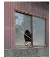
窓が割れた管理不全空家