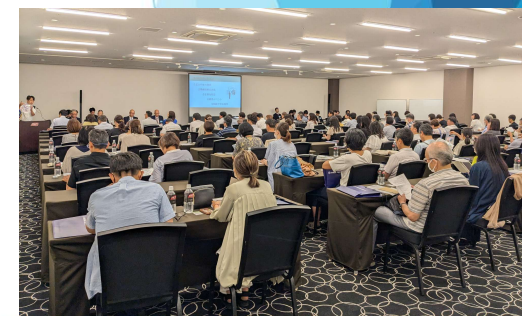
（県外大学保護者懇談会参加）