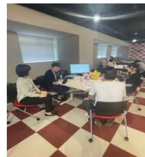
（大学主催就職説明会参加）