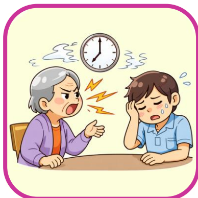
長時間のクレーム