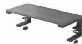
モニター台 机上台 幅55cm クラ ンプ式 平置き...