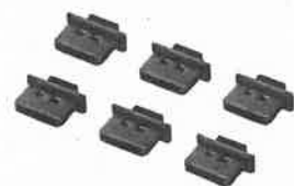
コネクタキャップ(DisplayPort 用・6個入...