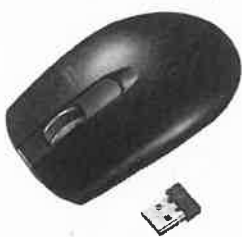
ワイヤレスマウス 無線 2.4GHz IR LED...