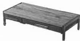
モニター台 机上台 幅54cm 引き出し 木製ダ...