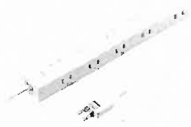
電源タップ 2P 10個口 1m 強力 マブネット...