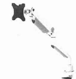
モニターアーム シングルアーム 薄型クランプ 32...