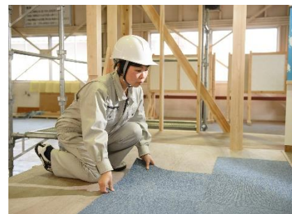
床・カーペットタイル貼り