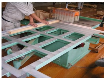
機械操作基本実習 (横切り盤)

木材加工機の取り扱いや操作方法を学び、住宅が完成するまでの工程、木造建築物についても理解を深めます。