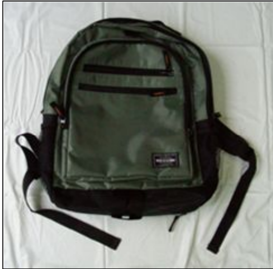
緑色リュックサック