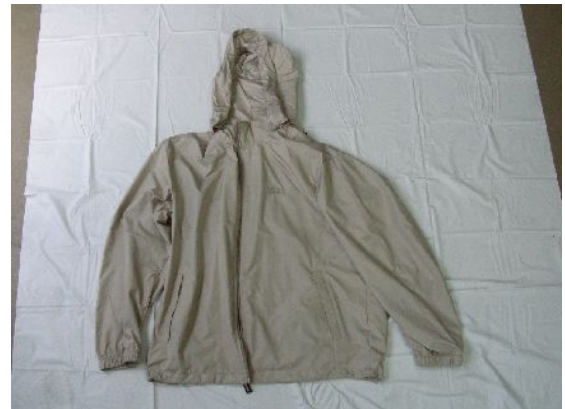
ベージュ色ウインドブレーカー