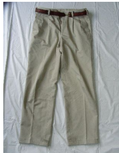
ベージュ色ズボン(胴囲82cm)