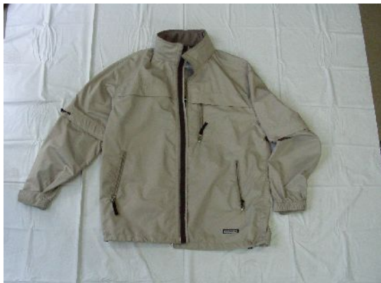
ベージュ色ジャンパー