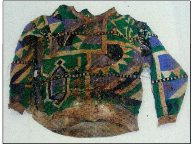
緑、紫、白、黒色の幾何学模様セーター