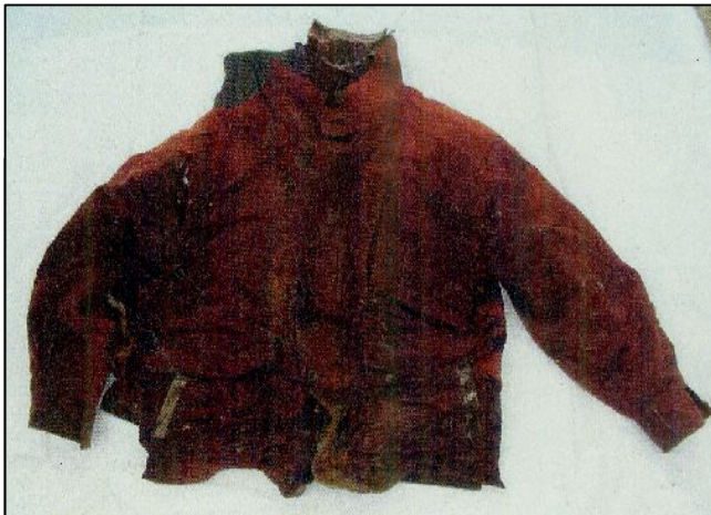
薄茶色スウェード地ジャンパー