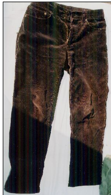
黒色コーデュロイズボン