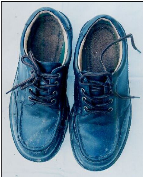
黒色トレッキングシューズ (25 cm)