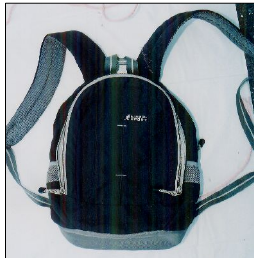
黒色リュックサック