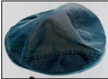
紺色ハンチング帽