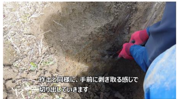
指導者向け用マニュアル内動画の一コマ