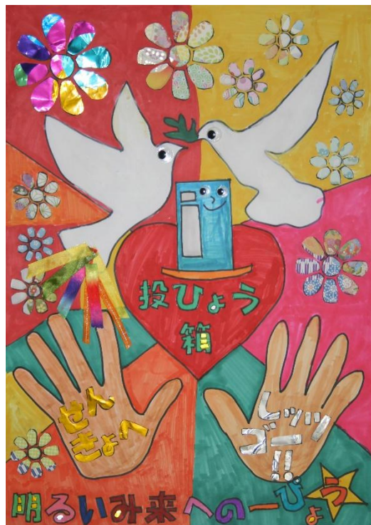
倉敷市立第五福田小学校 3年