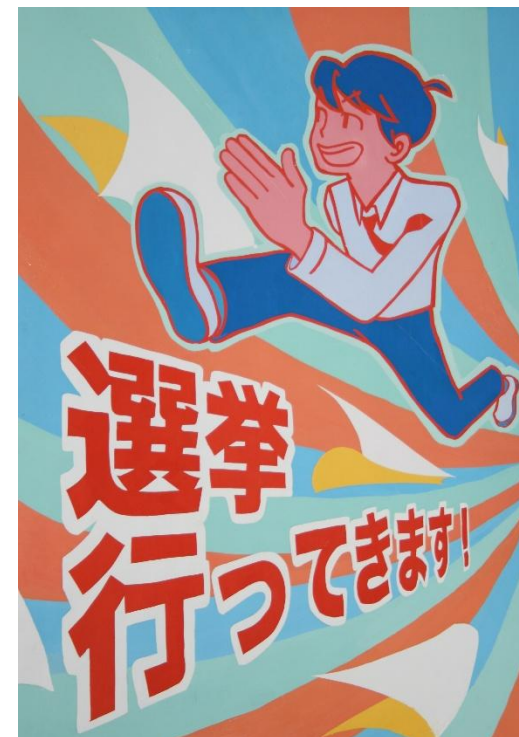
県立岡山工業高等学校 1年