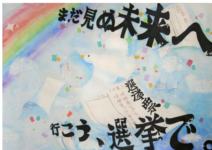
倉敷市立南中学校 2年