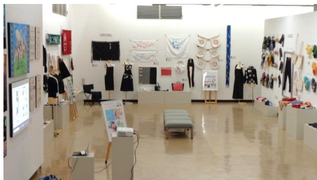
倉敷工業高校 テキスタイル工学科