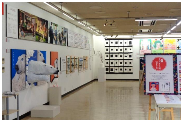
岡山工業高校 デザイン科