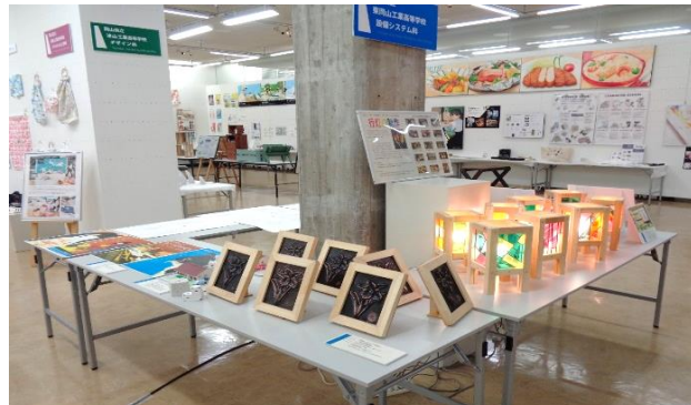
東岡山工業高校 設備システム科