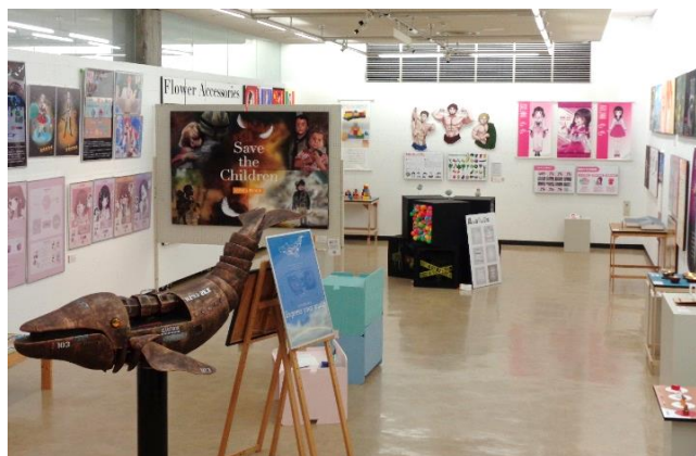
高梁城南高校 デザイン科