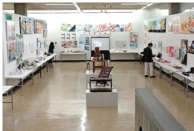
津山工業高校 デザイン科