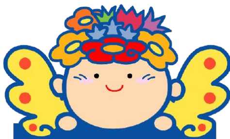
おかやまアダプト公式キャラクター アダビー