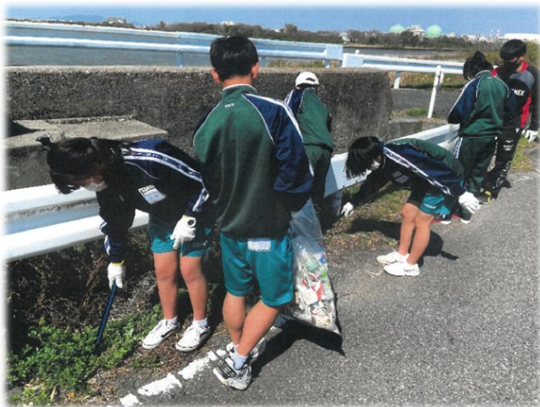
認定団体活動の様子（岡山市立福南中学校）