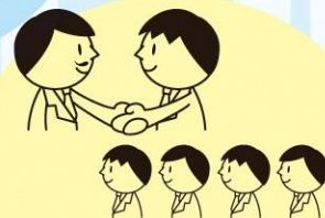
使用者と労働組合で結ぶ 労働協約