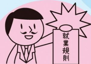
使用者が作成する 就業規則