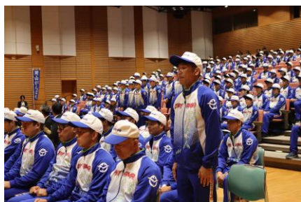
<第79回国民スポーツ大会 県選手団結団壮行式>