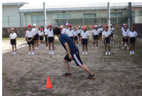
<スポーツ活動奨励事業(陸上)>