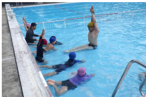
<スポーツ活動奨励事業(水泳)>

児童・生徒に対して各競技の入り口となる場や専門的な実技指導を受ける機会を提供し、競技人口の増加を図る。