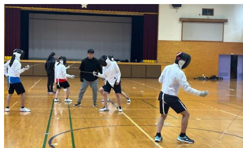
<マルチ サポート プログラム(フェンシング)>