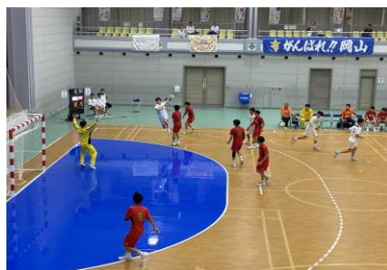
<第79回国民スポーツ大会 本大会>