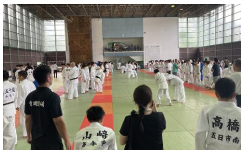
<チャレンジ ザ トップ!(柔道)>

競技者に必要な能力（身体的・精神的）を引き伸ばすために、競技の専門性を踏まえたトレーニング等を提供する。