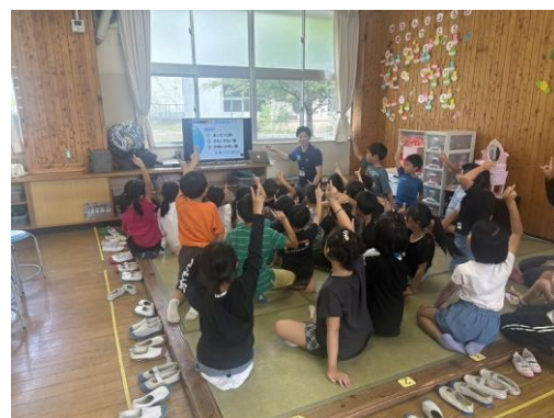
< 環境学習出前講座 >