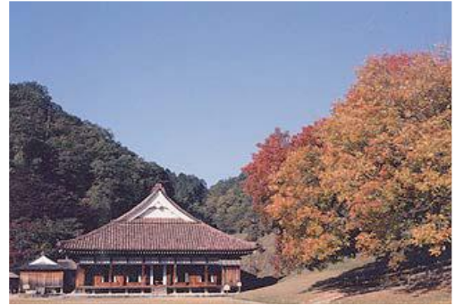
< 閑谷背景保全地区 >

「晴れの国おかやま景観百選」の発信等により、市町村や住民が一体となって良好な景観の創造に向けて取り組むよう意識の高揚を図る。