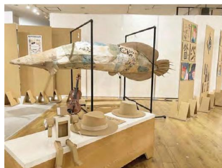
<文化がまちにある!プログラム>