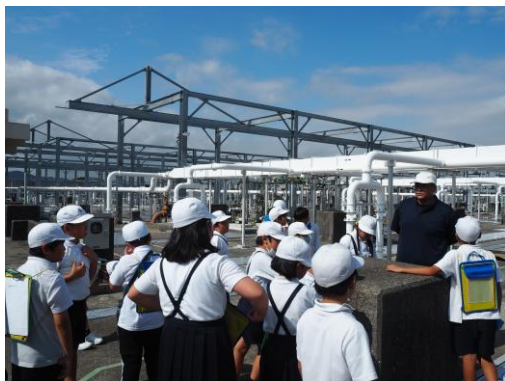
< 環境学習エコツアー >

次代を担う子どもたちが地域の中で自主的に取り組む環境活動である「こどもエコクラブ」への参加を呼びかけるとともに、環境学習会（ワークショップ）を開催する。