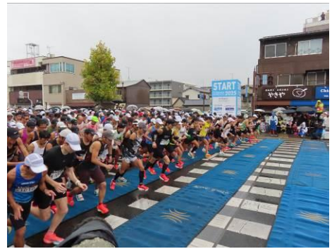
<おかやまマラソン2025>

また、大会開催に向け、県内外へのPRキャラバンの派遣、ランニング教室の開催等により、大会PRや大会開催機運の醸成に努めながら、本県及び岡山市のスポーツの振興や情報発信、地域の活性化を図る。