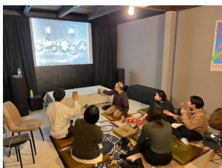
<これがOKAYAMA!プログラム>