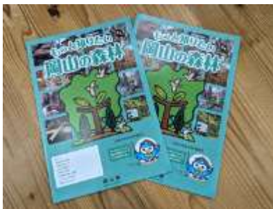
小学校5年生社会科副読本