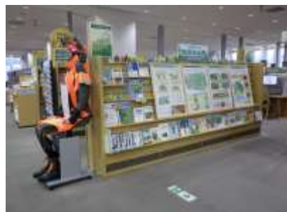
森林・林業の情報発信