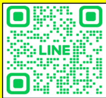
岡山モデル：二次元コード