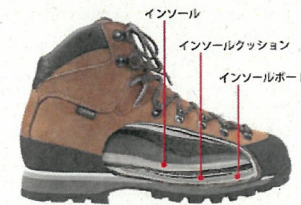
※画像はGK85のカットモデルです。

インソールボードには衝撃吸収性に優れたEVAをラミネートしました。これにより長時間歩行でも足裏全体にかかる衝撃を吸収し、ソフトな履き心地となっています。（内部構造）