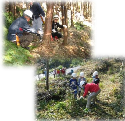
県・市町村・森林ボランティア 団体等による森林保全活動