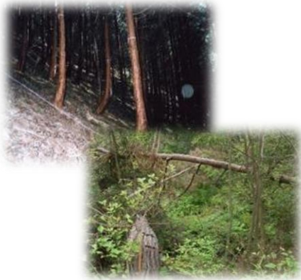
手入れが不足した森林

森林の重要性を県民の方々に普及啓発するとともに、県民各層が気軽に自主的かつ積極的に森林活動へ参加できるよう活動情報や場所の提供、技術指導など県民の社会貢献活動を支援することを目的としています。