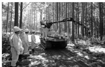
高校生への林業就業体験支援