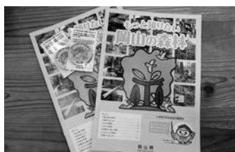
小学校社会科副読本の配付