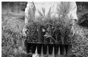
少花粉苗木の供給体制の構築