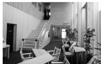
民間建築物等の木造・木質化