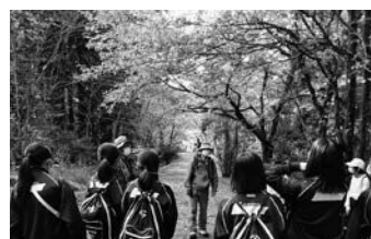
環境学習エコツアーの支援