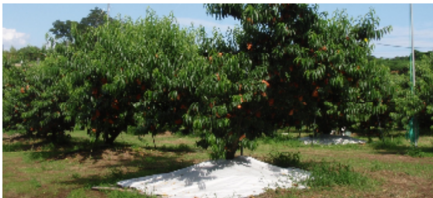
図1 部分的マルチ（4 m 四方）の敷設状況