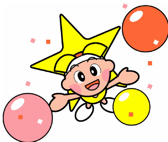
岡山県マスコット ももっち