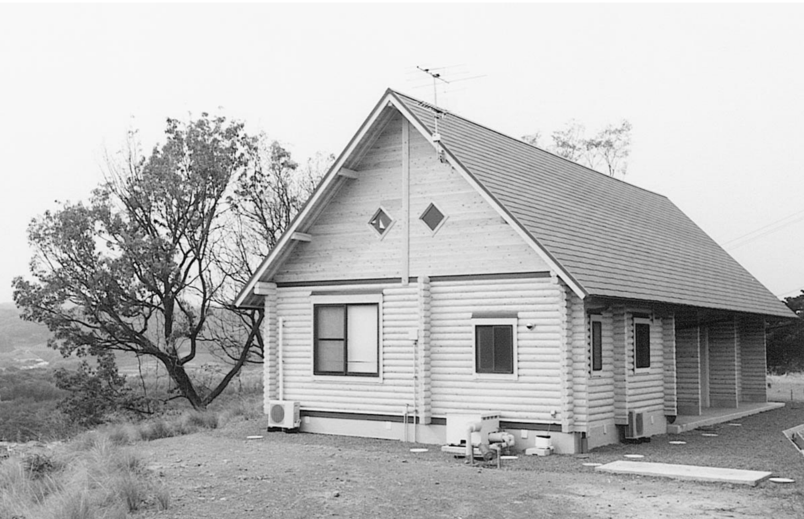
地域の木材利用施設「アグリサポート研修センター」(船穂町)