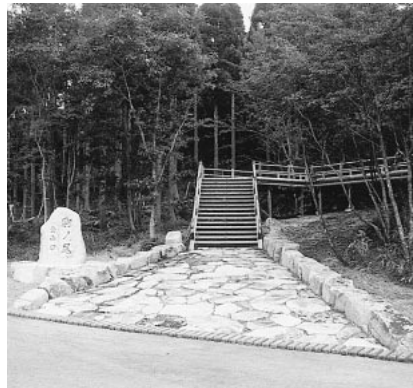
駒の尾登山道入口