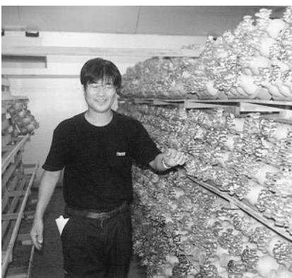
ヒラタケの発生状況

ヒラタケは、平成十年九月から、葉タバコ・ピオーネは、平成十二年度から栽培を開始しました。ヒラタケの栽培に当たっては、天候に左右されず、安定した生産を行うため、ピン栽培を取り入れました。しかし、生産施設への投資下資本が大きい割には、労働生産性が低く収益率が悪いのが現状です。改善策としては、収穫量の向上と単価を上げることだと思っています。