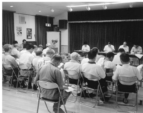
地元説明会 柵原町北和気地区