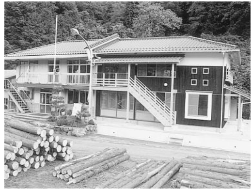
林業総合センター

構造上特筆すべき点は、既存の管理棟と結合させて建築し、二階部分を一つのフロアとして広いスペースを確保しているため、新たに新築した場合に比べ経費が削減できたことに加え、施設の利用や管理が合理的であることです。