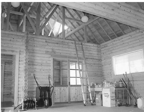
営農・研究棟内部

式で建設されており、総材積三二立方メートル、建築面積九八平方メートルで、その内実習室が六三平方メートル、研究室が二〇平方メートルとなっています。