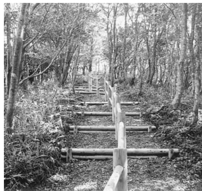
整備された登山道

登山口には、木の温もりを感じる休憩施設や広場があり、登山者等の憩いの場として利用されています。皆さんもぜひ一度、駒の尾山の自然を満喫されてみてはいかがでしょうか。