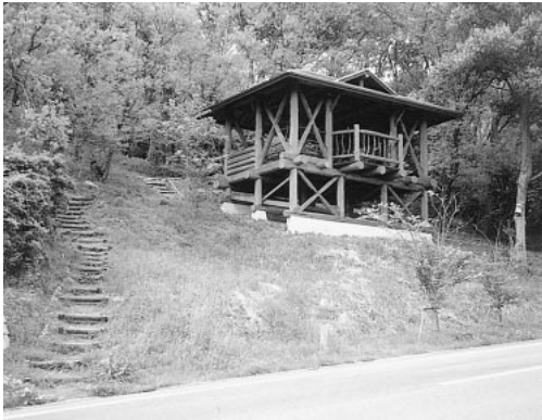
愛宕山の木造施設