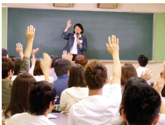
【伊東香織倉敷市長の講話の様子】