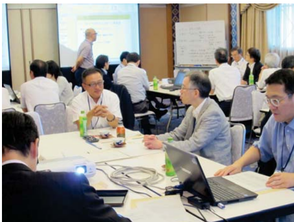
【グループワークの様子】

開催日:H27.8.2(日) 場所:ピュアリティまきび(岡山市) テーマ:「医師のライフイベント」「ローテーション」「突然の休職(病気等)」