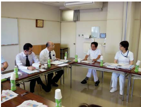
【地域の病院訪問の様子】

地域卒卒業医師を受け入れた場合の勤務環境等について院長等と意見交換を行い、地域卒卒業医師の受入体制の改善を要請しています。