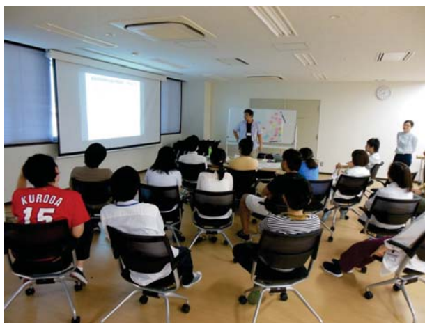
【グループ発表の様子】