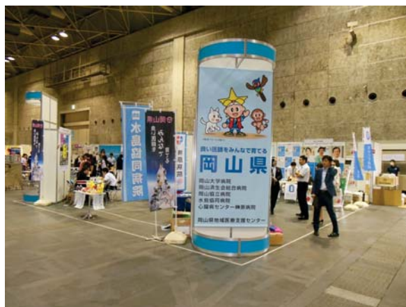
【岡山県ブースの様子】

【参考：その他出展病院】岡山医療センター、岡山中央病院、川崎医科大学附属病院、 川崎医科大学附属川崎病院、倉敷中央病院