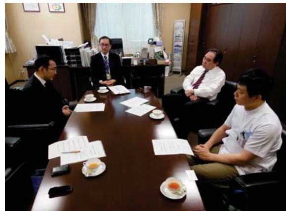
【初期臨床研修病院訪問の様子】

地域卒卒業医師の育成等について院長等と意見交換を行い、研修中にプライマリケア能力などが身に付けられるよう要請しています。