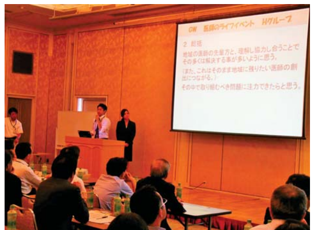
【グループ発表の様子】