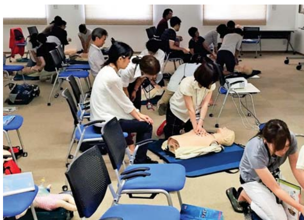
【AHA-BLS限定コース受講の様子】