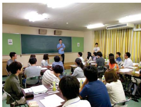
【ワークショップの様子】