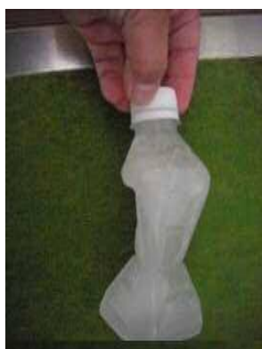
「手作り冷却グッズ」