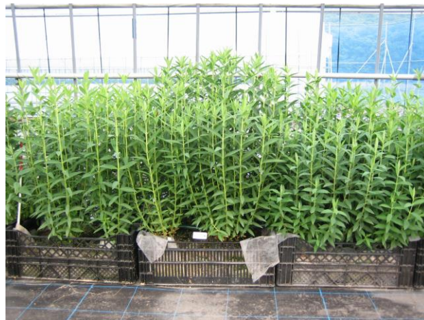
図1 コンテナ栽培風景