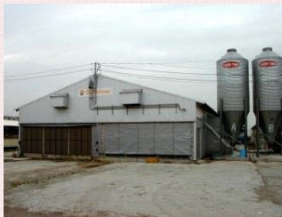
ウインドウレス鶏舎