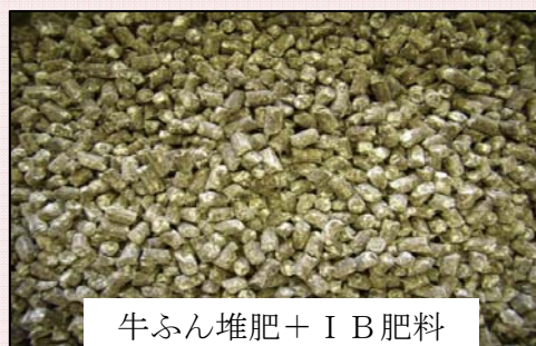
牛ふん堆肥 + I B 肥料

いずれも化学肥料の高い肥効と堆肥等の土づくり効果を併せもつ肥料として今後の研究開発・商品化が期待されている。