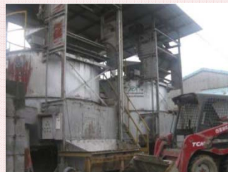
密閉縦型発酵装置