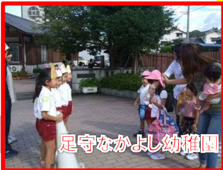
足守なかよし幼稚園

足守中学校区では、「未来へつながるプロジェクト」と題して、就学前から義務教育終了までの育ちが「つながる」よう、生活面と学習面で学校園の連携に努めています。