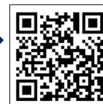
「共通予約システム」 二次元コード