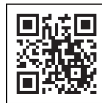
「コロナワクチンナビ」 二次元コード