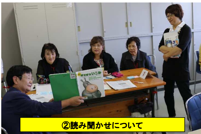
②読み聞かせについて