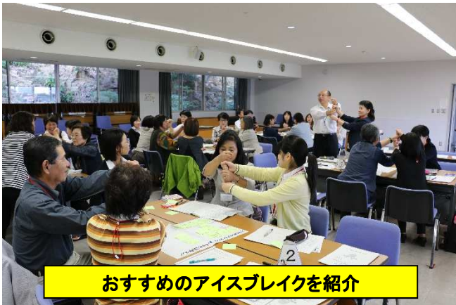
おすすめのアイスブレイクを紹介

この講座は、これまで親育ち応援学習リーダー養成講座を修了した方を対象にファシリテーターとしてのスキルアップを図るものです。