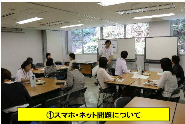
①スマホ・ネット問題について

「就学準備についての新しいプログラムは、待っていたものだったので、今後しっかり活用していきたいと思います。」