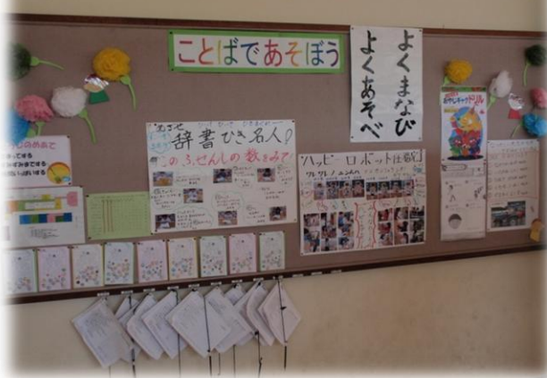
活動や取組等を見やすく掲示