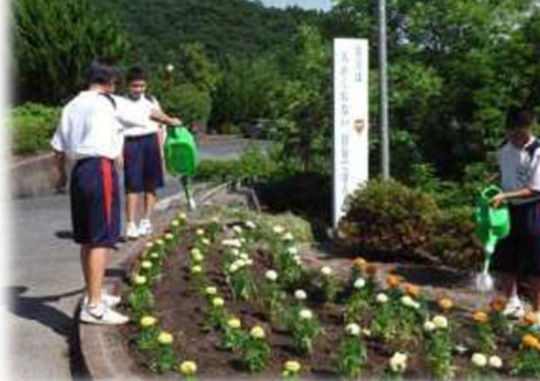
生徒達の活動で花壇を整備

これから津山教育事務所では校内環境づくりへの取組を「あなたの学校へズームイン」で紹介していきます