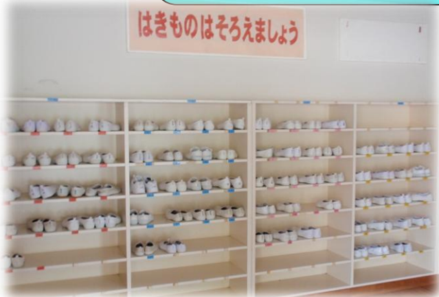
下駄箱はいつも靴がそろっています

下駄箱・ロッカー・本棚などの整理整頓 子ども達が世話をする鉢植えや花壇 掲示物や展示物で学校の取組を紹介 特別支援に配慮した教室掲示の工夫 等