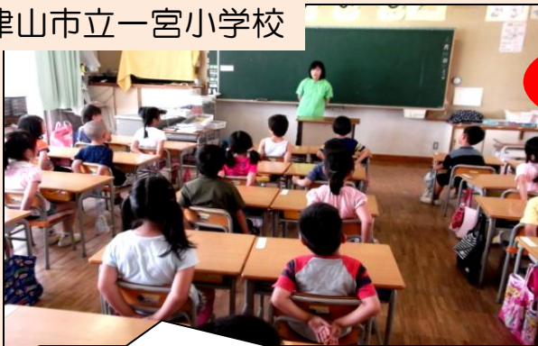
津山市立一宮小学校

1学期の成果を確認し、2学期の取組を重点化しましょう。授業のきまりを決めることだけで終わってはいけません。きまりが徹底されているかどうか为学校・学級の「差」となります。