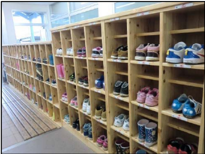
くつ揃え 全学年で取組の徹底