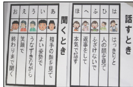
↑「話し方」「聞き方」の掲示と活用

授業改善による主体的な学習態度の育成と、補充学習等による基礎的な学習の充実の取組