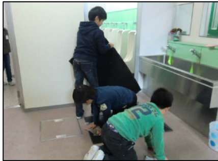
黙々そうじ 縦割り班活動による高学年の意識向上