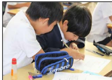
↑隣の友達と自分の考えを伝え合う