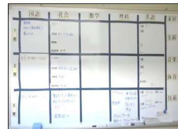
奈義町立奈義中学校