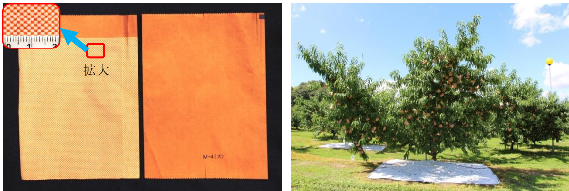
図1 機能性果実袋と慣行袋の外観（左）、部分マルチと組み合わせた様子（右）