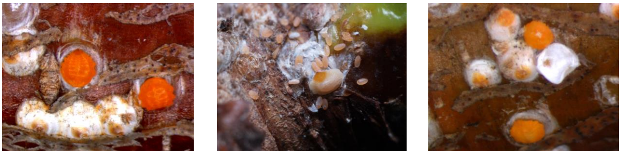
図3 カイガラムシ類の形態

左：ウメシロカイガラムシの雌成虫（体長2～3mm、オレンジ色）と雌成虫を覆ったカイガラ（白色）