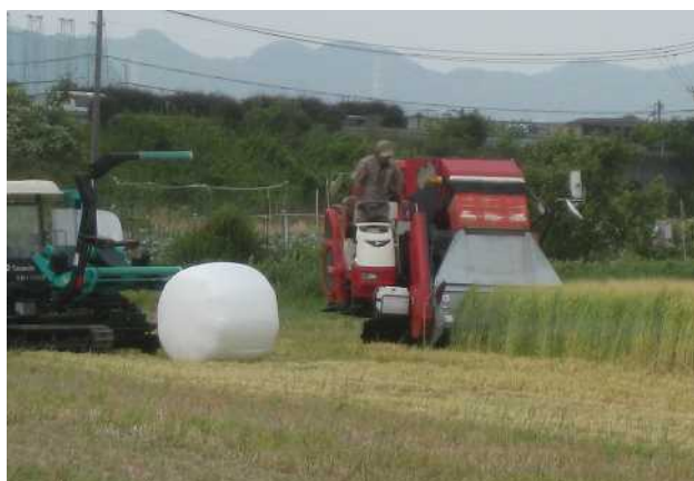
写真：出穂後30日の収穫調製の状況