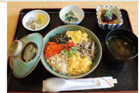
● くさぎ菜かけめしセット 950円

郷土料理まさば 加賀郡吉備中央町吉川4860-6 きびプラザ2F TEL.0866-56-8326 (営業時間) 11:00~20:00 (休業日) 火曜日