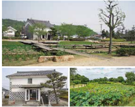
高松城址公園資料館