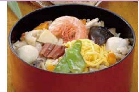
● どどめせ 550円

備前福岡一文字うどん 瀬戸内市長船町福岡1588-1 TEL.0869-26-2978 (営業時間) 10:00~15:00 (休業日) 毎週水曜日、第1・3火曜日 ※備前福岡の市でも販売しています。