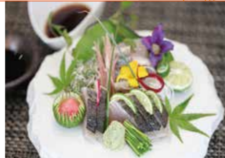
● 鯖の岡山塩たたき 1,320円

酒工房 独歩館 岡山市中区西川原185-1 TEL.086-270-8111 (営業時間) ランチ/11:30~14:30、ディナー/17:00~20:30 (休業日) 毎週水曜日、第1・3火曜日