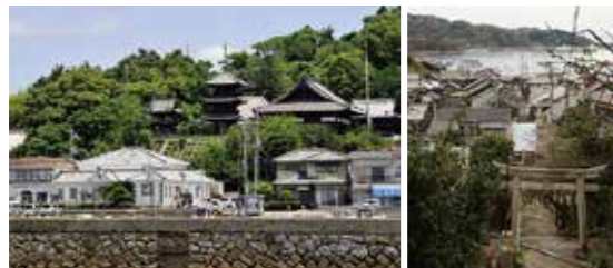
海から見た本蓮寺と牛窓海遊文化館