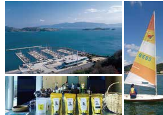
港の中のキッサテン