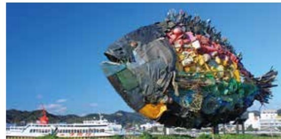
宇野のチヌ／淀川テック