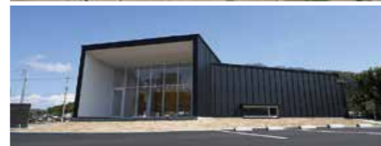
岡山市造山古墳ビジターセンター

全長は約350mで全国第4位の規模を持つ前方後円墳。墳丘上まで上がることができる前方後円墳としては最大です。駐車場にある「岡山市造山古墳ビジターセンター」では、造山古墳や日本遺産の紹介をしています。