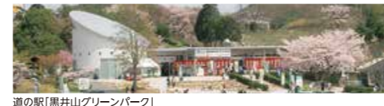
道の駅「黒井山グリーンパーク」