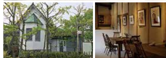
ミュージアムショップ&amp;カフェ「椿茶房」