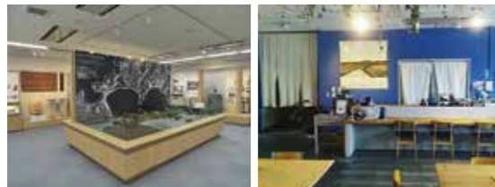
喫茶 さざなみハウス