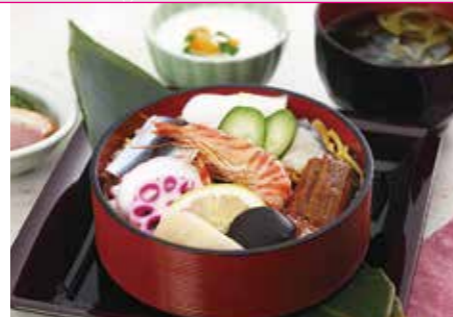
● 岡山ばらずし 1,750円

後楽園 四季彩 岡山市北区後楽園1-5 (後楽園 外苑) TEL.086-273-3221 (営業時間) 喫茶/10:00~16:30、食事/11:00~15:00 (休業日) 無休