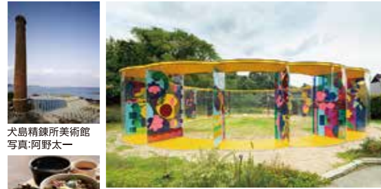
犬島精錬所美術館 たこ飯