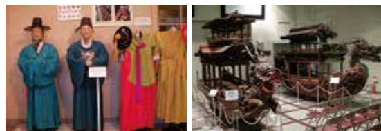
衣装体験が出来ます