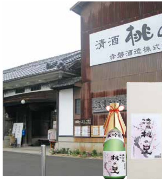
備前国分寺跡から出土した銅印