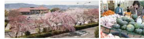
道の駅「一本松展望園」