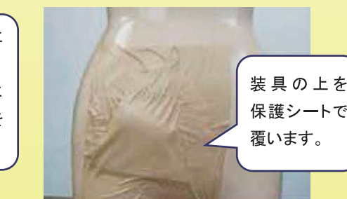
⑥装具の上から保護シートを貼る場合