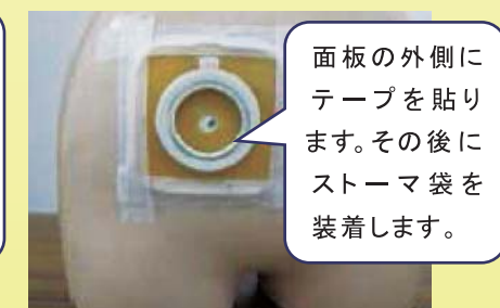
⑤全面皮膚保護剤の場合