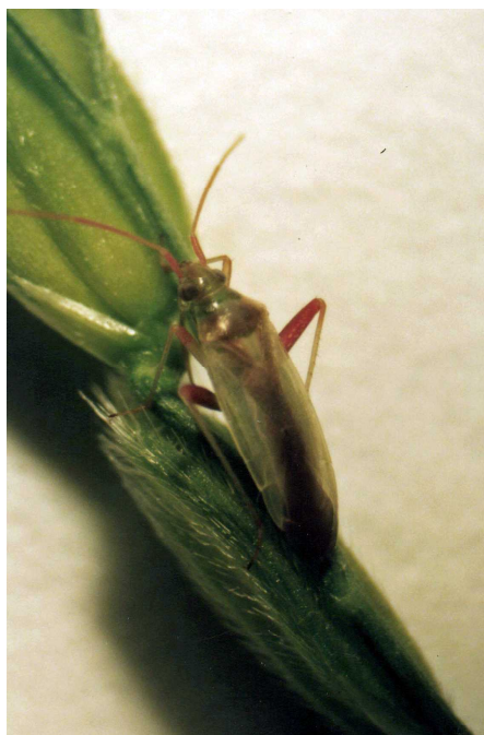
アカスジカスミカメ成虫(体長約5mm)