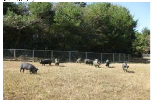
広い運動場で走り回る育成豚

その後、4～5ヶ月齢から農家に届けるまで、広々とした放飼場でしっかりと運動をさせて、足腰の強い繁殖用豚として育成しています。当然のことながら、育成中や供給する際は、駆虫薬による消化管内寄生虫の駆除を行い、供給には万全を期しています。