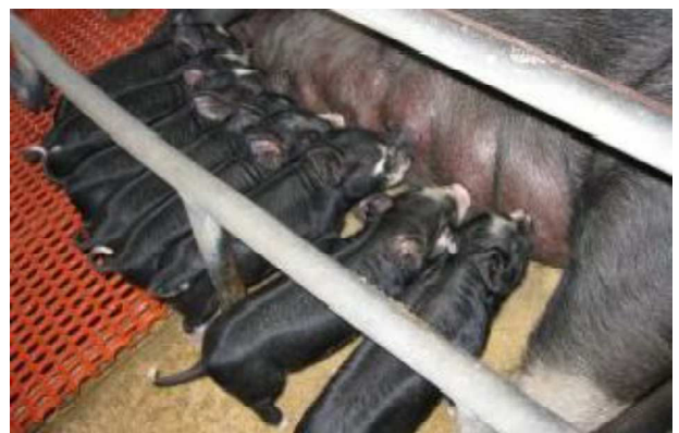
おいしそうに乳を飲む子豚