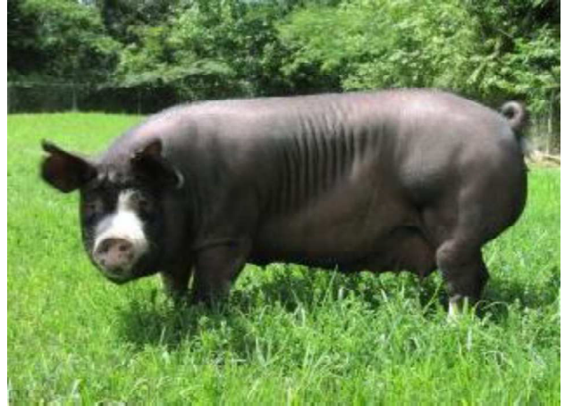
「おかやま黒豚」の母豚

当センターでは、肉質だけではなく、優れた繁殖性を兼ね備えた「おかやま黒豚」を今後も改良・増産し、生産者に安定的に供給していくことで生産拡大に努め、より多くの消費者の方々に美味しさを堪能して頂きたいと考えています。