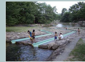
すながわこうえん 砂川公園

鬼城山の山裾を流れる砂川沿いに整備された公園。炊事棟やトイレが完備されたキャンプ場のほか、ウォータースライダーなどの親水施設がある。