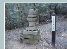
みやう ばか 皇の墓

温羅伝説の発祥地といわれる古代山城。標高400mの鬼城山の山頂に3kmにわたって続く石垣や土塁はわが国最大級の規模を誇る。