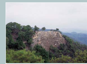
きのじょう 鬼ノ城

鬼城山の山裾を流れる砂川沿いに整備された公園。炊事棟やトイレが完備されたキャンプ場のほか、ウォータースライダーなどの親水施設がある。